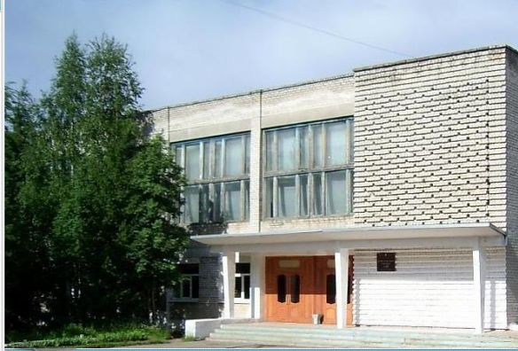
ГОУ СПО ЧУСОВСКОЙ ИНДУСТРИАЛЬНЫЙ ТЕХНИКУМ